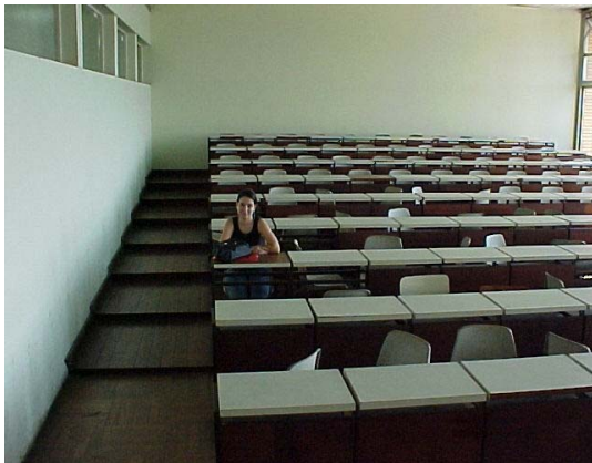
Fig. 3 - Sala de Aula da Faculdade de Arquitetura