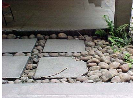
Fig.2 - Faculdade de Letras – pavimentação ruim