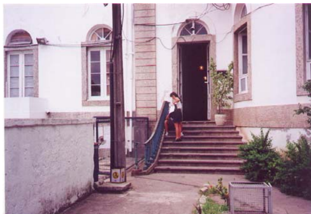
Fig.4 - Faculdade de Educação no Campus da Praia Vermelha