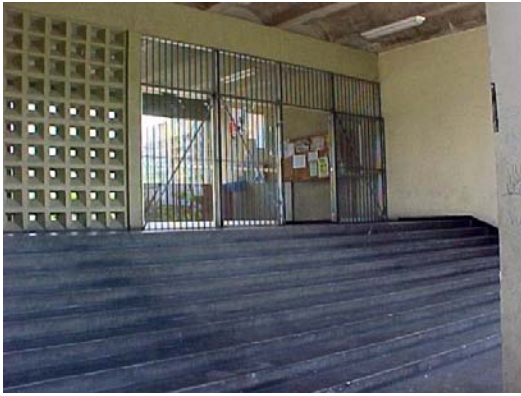
Fig 1 - Faculdade de Educação Física – unidade do Campus da Ilha do Fundão com muitas barreiras de acessibilidade