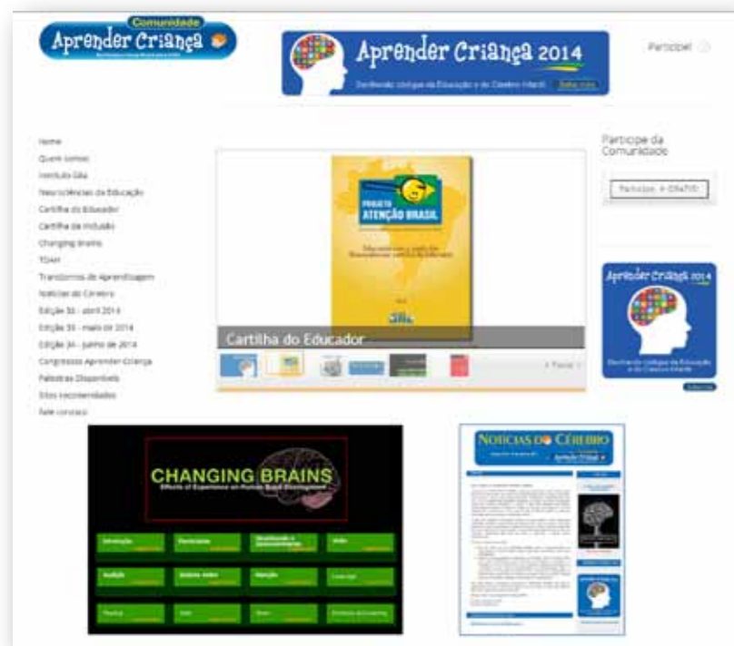
Portal da Comunidade Aprender Criança www.aprendercrianca.com.br

Entre as contribuições mais importantes da Comunidade Aprender Criança destaca-se o Projeto Atenção Brasil 19 , um amplo e inédito estudo populacional iniciado em 2009 e ainda em andamento, realizado a partir de uma amostra final de 5.961 crianças e adolescentes de 87 cidades e 18 estados, cobrindo as cinco regiões nacionais. Com a participação voluntária de mais de mil membros da Comunidade, após planejamento amostral cuidadoso, foram selecionados 124 professores que representavam adequadamente a distribuição demográfica da população infantil Brasileira. Esses professores foram treinados via internet em como selecionar a amostra e aplicar os questionários aos pais e professores. A fase inicial do projeto resultou em mais de duas dezenas de artigos científicos publicados em revistas indexadas, além de prêmios em congressos nacionais e internacionais. No entanto, há que se destacar o fruto mais importante desse estudo, a “Cartilha do Educador: educando com a ajuda das Neurociências” 20 .